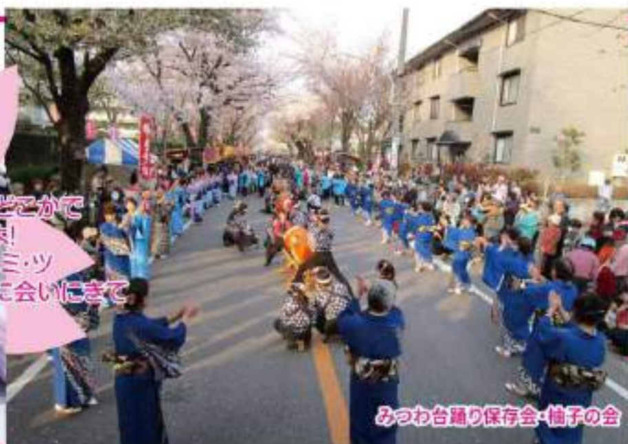
みつわ台踊り保存会・柚子の会