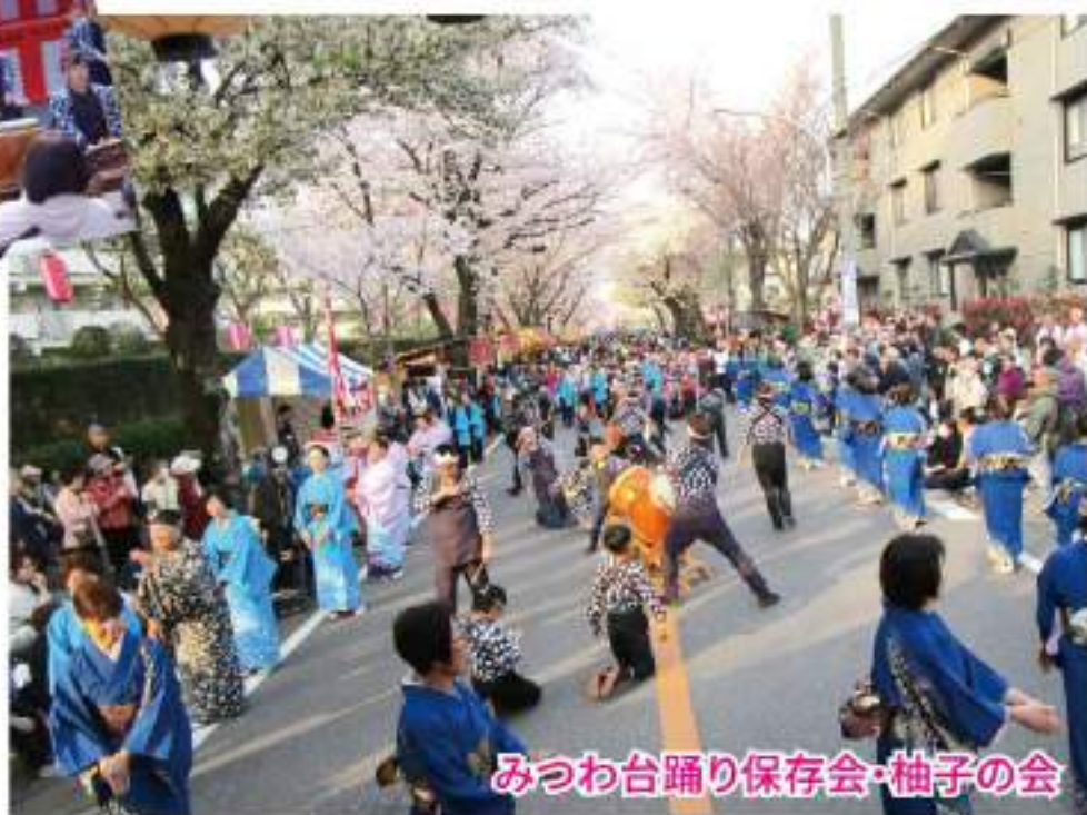
みつわ台踊り保存会・柚子の会